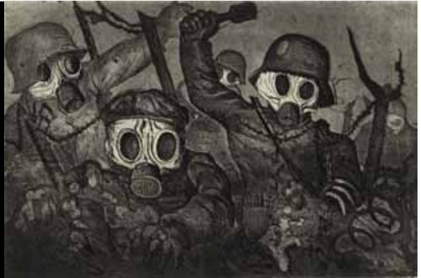
Otto Dix 1924

i Nødebo Præstegård 6.-7. september 2014