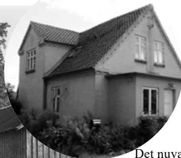
Det nuværende hus på Søvej 8B