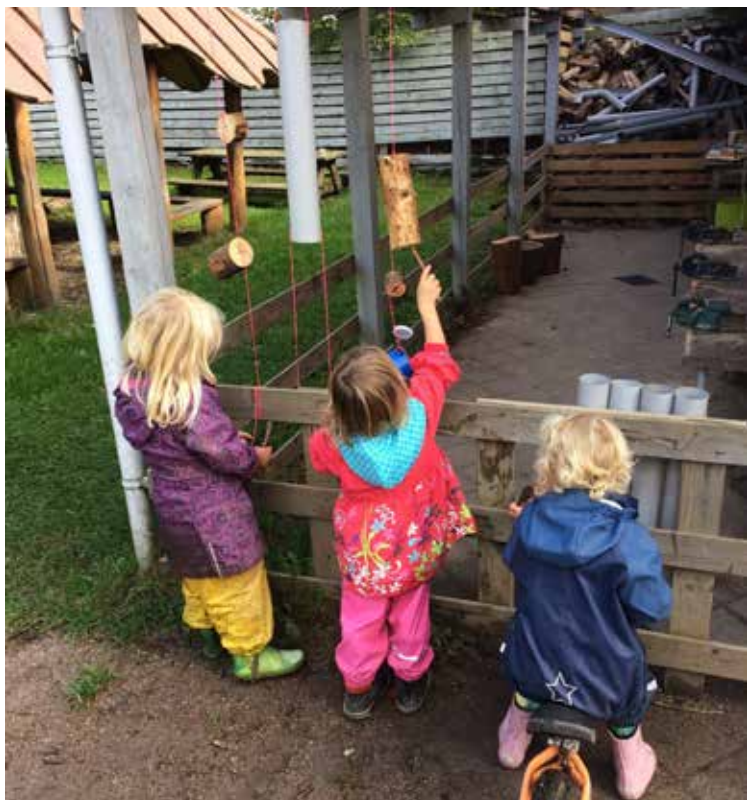
Leg med lyde ved værkstedet