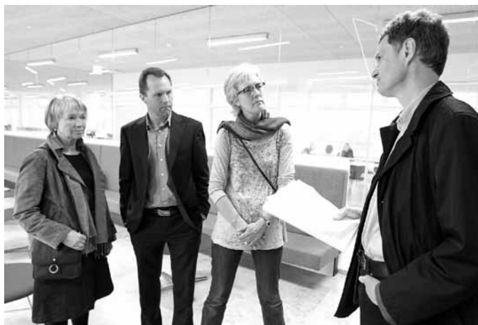
Overrækkelsen af underskrifterne fra Nødebos busgruppe