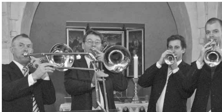
Medvirkende: Blæsere fra ROYAL DANISH BRASS

Nytårsdag 1. Januar 2011 Gadevang kirke kl.14 og Nødebo kirke kl.16